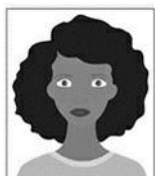
Figura 1. Modelo de Foto Frontal